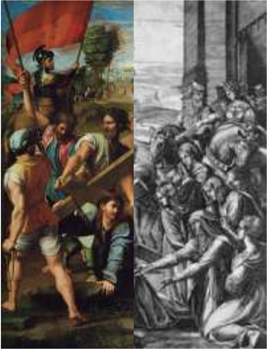
El Pasma de Sicilia, Rafael Sanzio, 1515. Museo del Prado