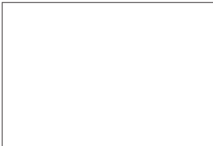
Papeleta en Blanco